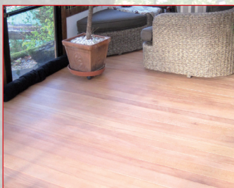
... für Bodenbeläge, Treppen, Verkleidungen im Wohn- bereich und in Küchen.

Juraparkbuche: das Holz aus der Region für traumhafte Wohnqualitäten.