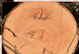
... ins Sägewerk Gubler nach Kienberg