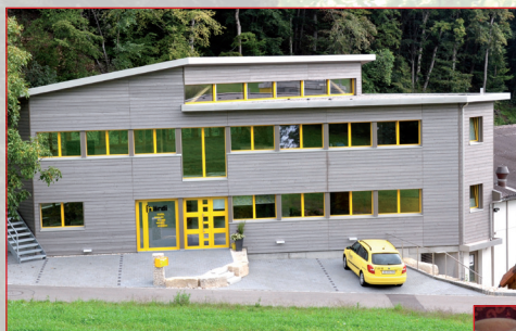
... fertig verarbeitet in unserem Betrieb ...

Juraparkbuche: das Holz aus der Region für traumhafte Wohnqualitäten.